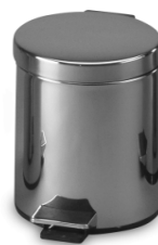
SLZN 11 – obj. č. 95110 nerezový koš s PVC vložkou, objem 5 l., ø 205 x 290 mm, povrch lesklý