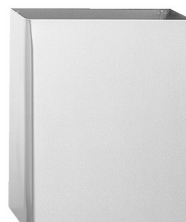
SLZN 23 – obj. č. 95230 nerezový závěsný odpadkový koš, objem 26,5 l., rozměr 360 x 160 x 435 mm, povrch matný