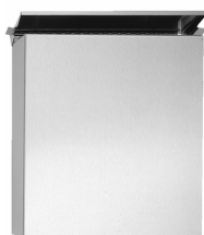
SLZN 24 – obj. č. 95240 nerezový závěsný odpadkový koš s poklopem, na hygienické potřeby, objem 4,5 l., rozměr 200 x 102 x 246 mm, povrch matný