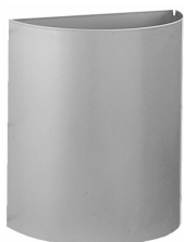
SLZN 22 – obj. č. 95220 nerezový závěsný odpadkový koš, objem 12 l., rozměr 300 x 160 x 350 mm, povrch matný