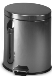
SLZN 15 – obj. č. 95150 nerezový koš s PVC vložkou, objem 12 l., ø 250 x 400 mm, povrch lesklý