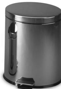
SLZN 12 – obj. č. 95120 nerezový koš s PVC vložkou, objem 20 l., ø 295 x 490 mm, povrch lesklý